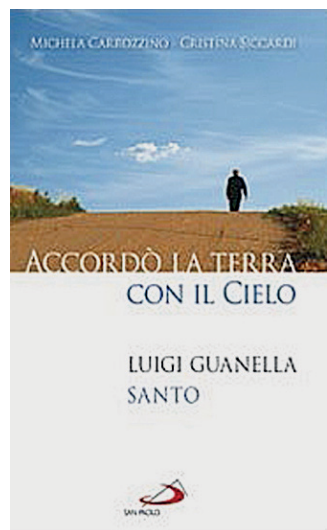
La copertina del libro edito da Paoline

operato da giovane sacerdote e fondatore, nelle province di Sondrio e di Como. Un piccolo "Cammino di Santiago" tra lago e monti che si snoderà raccordando ben 27 luoghi di interesse guanelliano e che può essere e anche un importante volano turistico oltre che culturale. Il progetto costa oltre un milione di euro e ha ricevuto un finanziamento al 50% dalla Fondazione Cariplo, che ne ha apprezzato l'indubbio interesse culturale. Anche Villa Sapori partecipa con 30mila euro. Proprio ieri la giun-