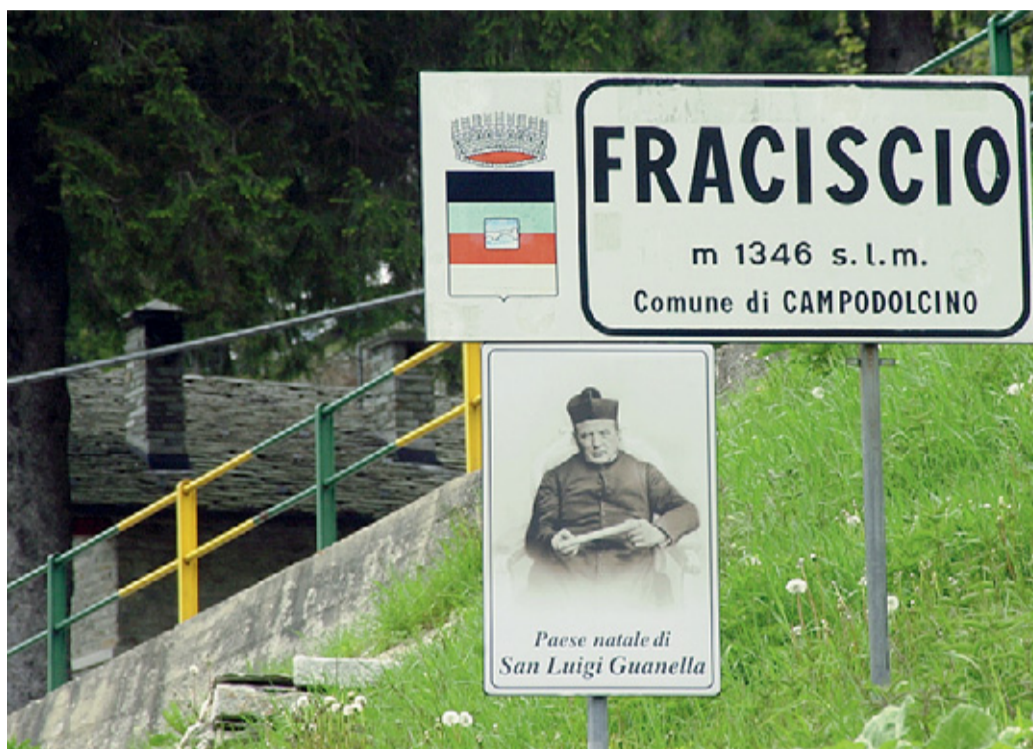
Il profilo di Luigi Guanella (1842-1915) all'ingresso della località valtellinese in cui nacque il santo

È questo il senso del percorso "Sui passi di don Luigi Guanella" che la Provincia "Sacro Cuore" dei Servi della Carità ha realizzato in occasione della canonizzazione del Fondatore, parte di un progetto più ampio sostenuto dalle Figlie di Santa Maria della Provvidenza, da Fondazione Cariplo, da numerose istituzioni, enti e associazioni locali. Un piccolo "Cammino di Santiago" tra i nostri monti e le nostre valli, che ricalca antichi tracciati (Via Spluga, Via Bregaglia, Via Francisca, Via Regina) percorsi in lungo e in largo dal "nostro" don Guanella, montanaro e camminatore instancabile. L'itinerario, di circa centocinquanta chilometri in tutto (come centocinquanta erano le Ave Maria del Rosario che egli amava recitare durante i suoi viaggi), si snoda dalle aspre montagne della valle San Giacomo alle paludi del Pian di Spagna, ai terrazzi coltivati della bassa Valtellina, alle sponde del Lario, alle città di Chiavenna e Como: un colorato ventaglio di paesaggi attraversati dal cammino, sotto «quel cielo di Lombardia, così bello quand'è bello, così splendido, così in pace», immagine di quella mano provvidente di Dio in cui don Guanella ha sempre confidato. Ed è lo