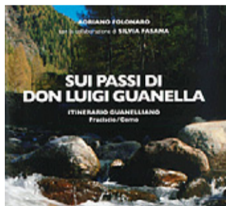
La copertina della guida

Edifici religiosi e musei ci parlano di questo grande santo della carità